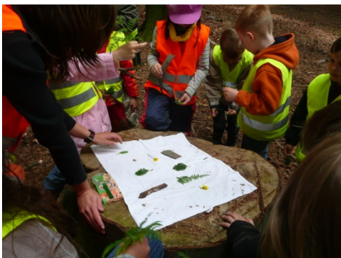
Kinder spielen Waldmemory

Wald- und Kunstpädagogik wird so auf sanfte Art zusammengeführt.