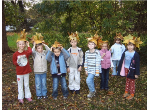
Kindergruppe mit selbstgebauten Laubhüten